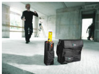
Wera 2go 7 Vysoký box na nářadí.